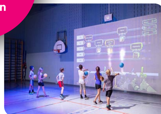
Salle de sport interactive

Votre soutien est nécessaire pour le développement des enfants